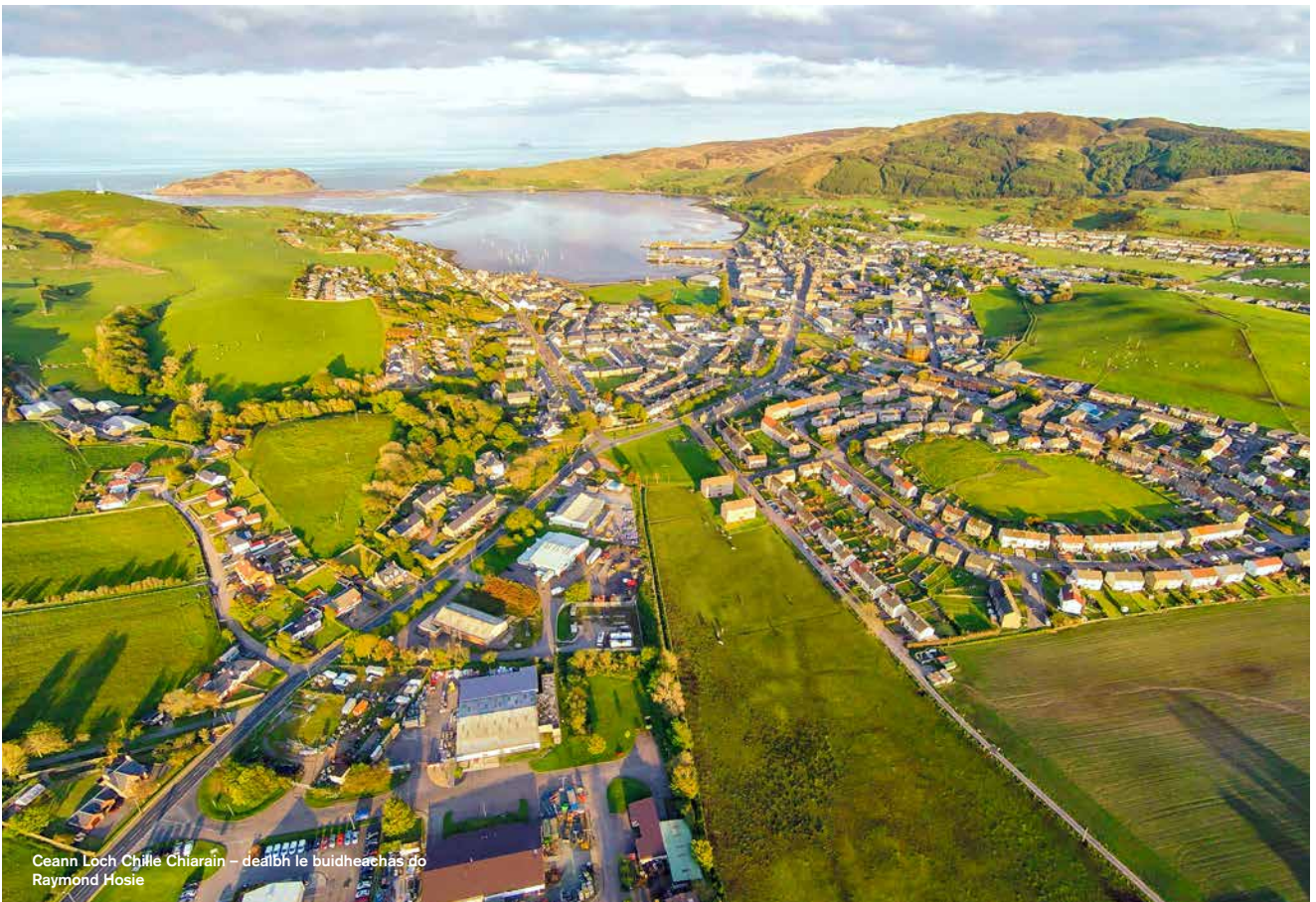
Ceann Loch Chille Chiarain

Covid-19, agus gnìomhachasan air feadh na Gàidhealtachd agus nan Eilean a' feuchainn ri faighinn seachad air a' bhuidheann eaconamaich, ach cuideachd mi-chinnt a bharrachd mar thoradh air Breatainn a bhith a' fàgail na Roinn Eòrpa, astar atharrachaidh teicneòlach a tha a' sìor fhàs, cuideam leantainneach air ionmhas poblach na RA, agus àrdachadh ann an draghan àrainneachd am measg a' mhòr-shluaigh.