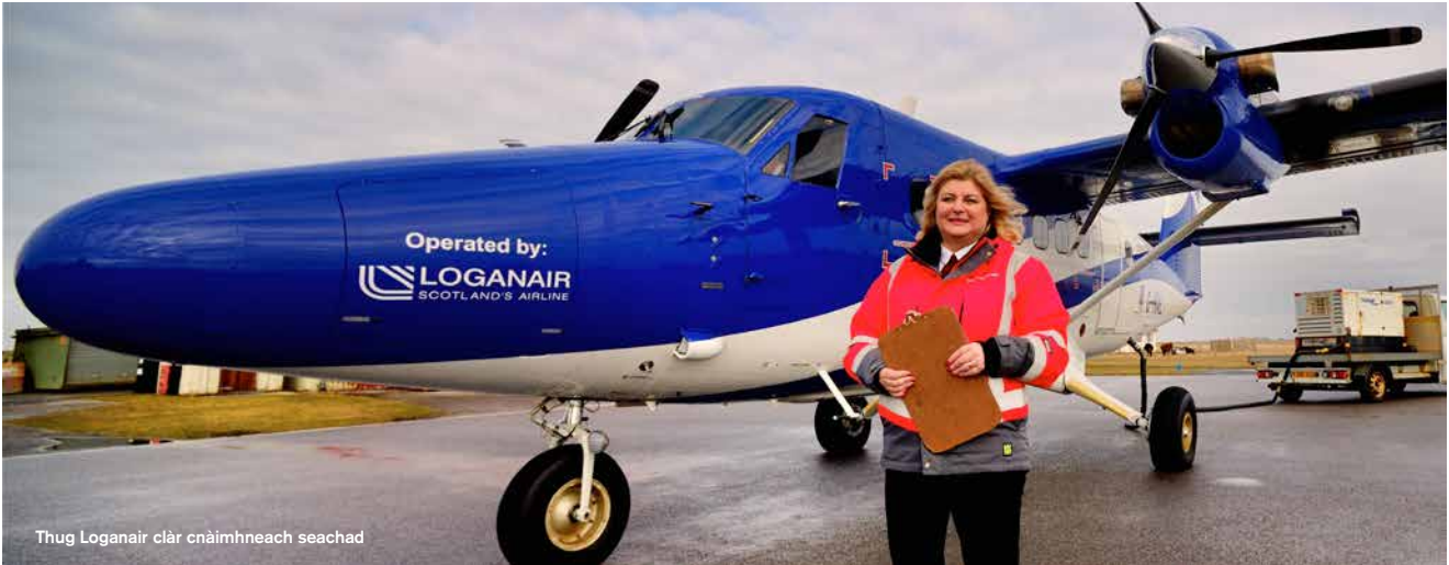
Thug Loganair clàr cnàimhneach seachad

Mar thoradh air an fhòcas soilleir air cho cudromach 's a tha deagh chonaltradh, bha conaltradh nas fheàrr eadar Bòrd HIAL, na sgiobaidhean againn agus an luchd-ùidh againn uile. Rinn an aplacaid Covid-19 aig HIAL a chaidh a thoirt a-steach anns a' Ghiblean cinnteach gum b' urrainnear teachdaireachdan agus ùrachaidhean a chur gu luath agus gu soilleir do na buill sgioba againn. Chaidh duilleagan fiosrachaidh sònraichte a chur ri eadra-lìon agus làrach-lìn na companaidh, a chaidh ùrachadh gu cunbhalach le stiùireadh agus fois-inntinn.