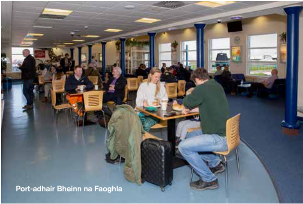
Port-adhair Bheinn na Faoghla