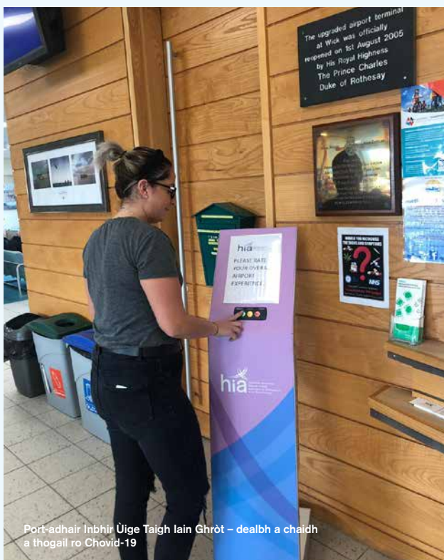
Port-adhair Inbhir Ùige Taigh Iain Ghràt – dealbh a chaidh a thogail ro Covid-19

a' lughdachadh na buaidh àrainneachdail againn agus a' stiùireadh a' ghluasaid ann an seirbheisean adhair gu àm ri teachd a bhios beag-charboin air a' Ghàidhealtachd agus sna h-Eileanan