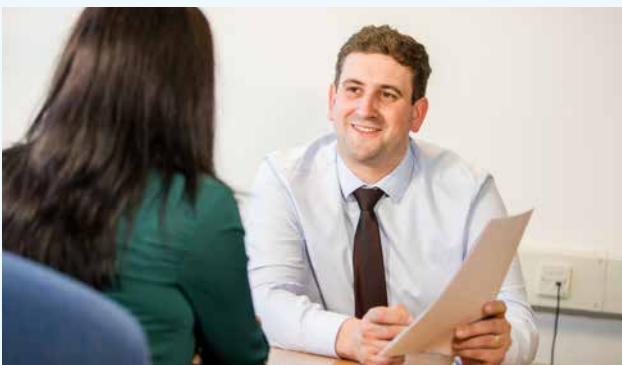
Dealbh ro Chovid-19

Ann an raon gnìomhachais far a bheil sàbhailteachd ro-chudromach, bha sinn a-riamh a' feuchainn ri dhèanamh cinnteach gu bheil na sgilean agus an t-eòlas aig a h-uile duine againn gus an dreuchd aca a choileanadh a bharrachd air na buadhan corporra is inntinn. Tha an cuideam againn air ionnsachadh fad-beatha a' cuideachadh le bhith a' dèanamh cinnteach gu bheil na sgilean riatanach aig an luchd-obrach againn gus taic a thoirt dhan ath ghinealach ann an roinn nan seirbheisean adhair. Ann an 2020, ghluais am prògram againn uile de thrèanadh an luchd-obrach air-loidhne: Tha sinn an dùil gun lean seo air adhart san àm ri teachd a' toirt chothroman dhuinn a bhith nas èifeachdaiche agus nas sùbailte ann a bhith a' coileanadh nam feumalachdan trèanaidh againn.